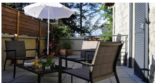
■ Les deux chambres de l'étage donnent sur une terrasse.